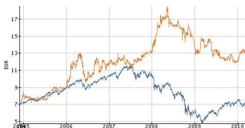
depuis décembre 2004