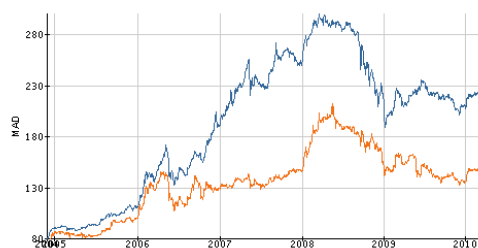
depuis décembre 2004